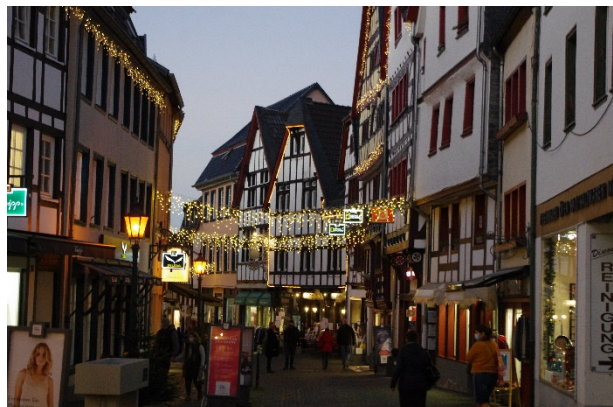
(Foto: Winterbeleuchtung von Bad Münstereifel ist von Hubert Jost)

Ein Positiv-Beispiel für ein Verfügungsfonds-Projekt in Bad Münstereifel gibt es bereits aus dem letzten Jahr, als die neue Winterbeleuchtung in der Kernstadt durch ein Gemeinschaftsprojekt des Stadtmarketingvereins und des City Outlets realisiert wurde.