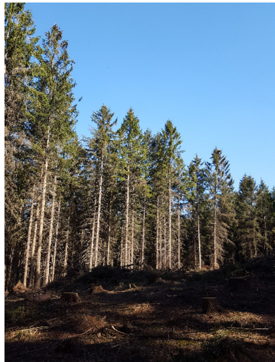
Aktuelle Borkenkäferschäden an Fichten auf trockenen Standorten und durch Vorschäden bereits exponierte, stark gefährdete Randlagen.

Zu großflächig sind die Schäden, dass man ihnen kurzfristig Herr werden könnte. Durch die offenen Schlagfronten entstehen ungeschützte Prall-Sonnenlagen, wo Folgeschäden zu erwarten sind.