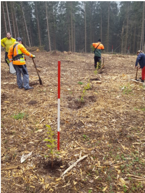
Pflanzaktion 2019 im Stadtwald Bad Münstereifel

maschutzleistung überproportional gut ab. So wird im Stadtwald auf 36% der Holzbodenfläche durch die Baumartengruppe Fichte, 53% der Klimaschutzleistung erreicht. Die Klimaschutzleistung entspricht damit ca. 7.200 Tonnen Kohlendioxid-Äquivalente. Bei einem pro Kopf Verbrauch von 11,4 Tonnen (2015) bindet diese Baumartengruppe damit die Emissionen von 632 Personen.