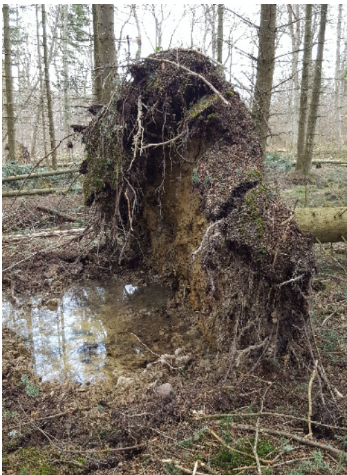
Aktuelle Windwürfe auf vernässten und staunassen Waldstandorten am „Faulen Feld“

Vor allem auf staunassen Standorten wie z. B. dem „Faulen Feld“, hatten die Fichten zwar über Jahrzehnte Glück gehabt, konnten aber keine stabilen Wurzeln ausbilden und fielen in Folge der o. a. Stürme großflächig um.