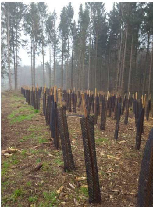
Fertige Fläche im Wald